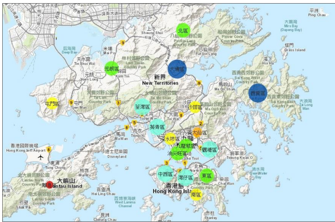
圖 2：社區健康資訊系統網上截圖 2，網址： http://www.pori.hk/cicd-mask-reserve-map